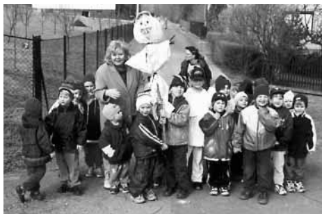
Tradiční jarní vynášení Moreny