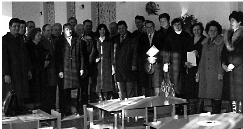
Slavnostní otevření školy v roce 1984