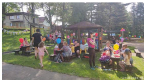
Den dětí se smažením vaječiny