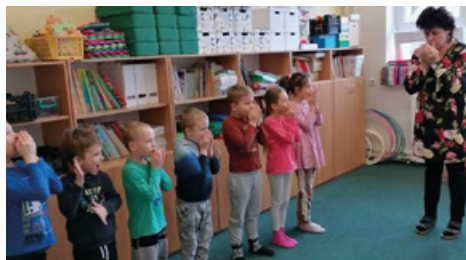
Návštěva ZŠ Morávka – předškoláci v 1.třídě