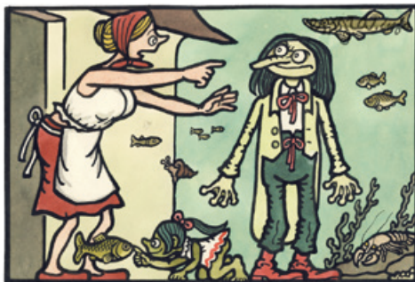
(z otázky na české ilustrátory)